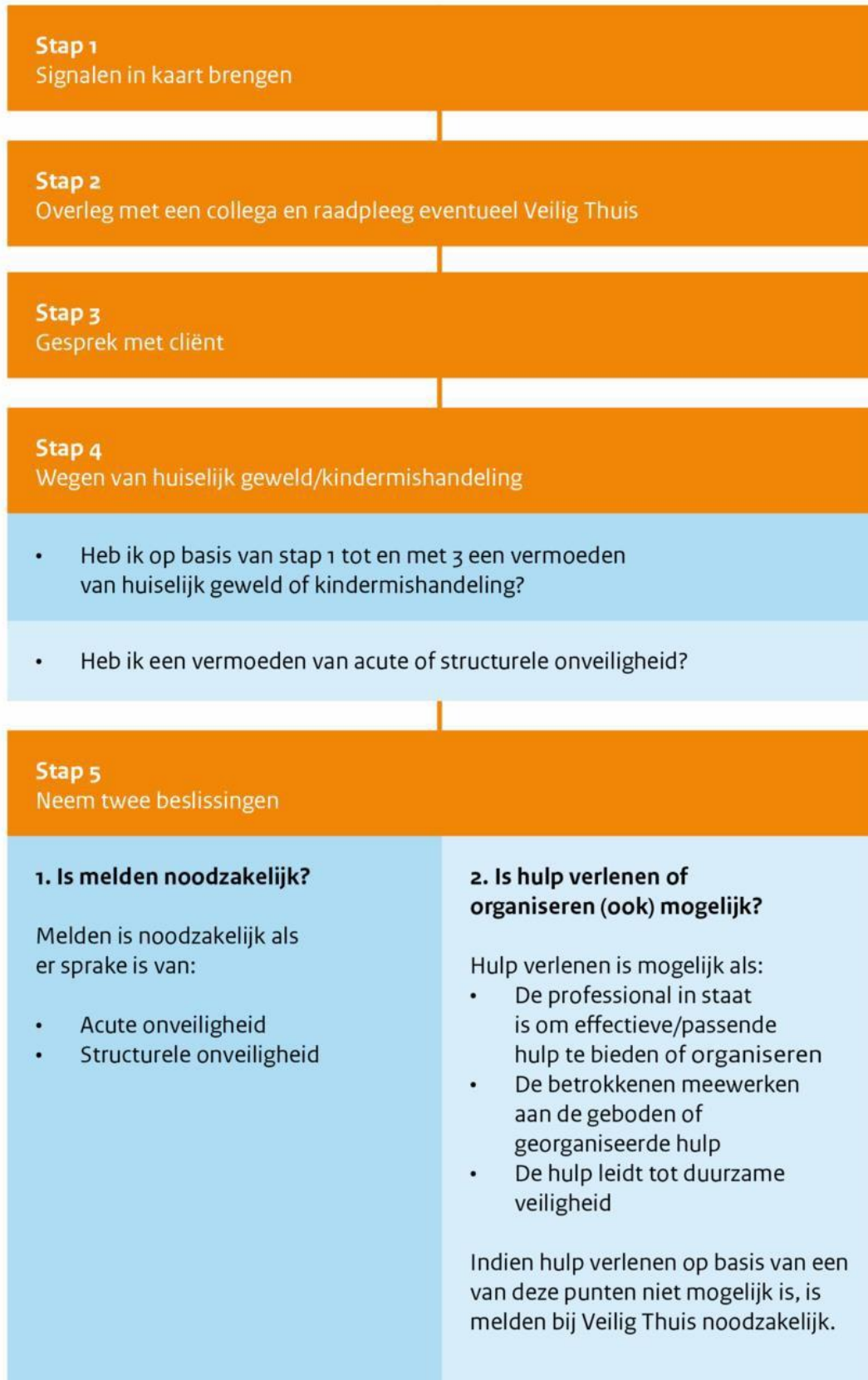
Figuur 1: Stappenplan verbeterde meldcode